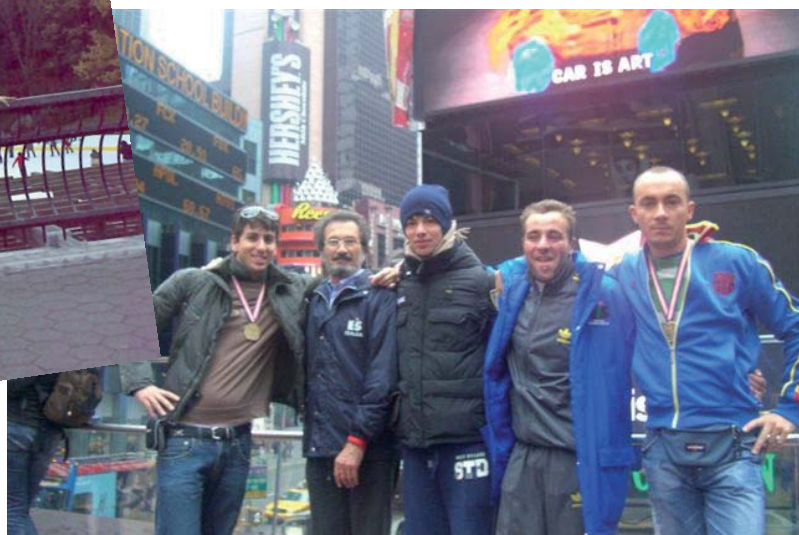
Nelle foto sopra i partecipanti dell'Endas Cesena alla maratona di New York