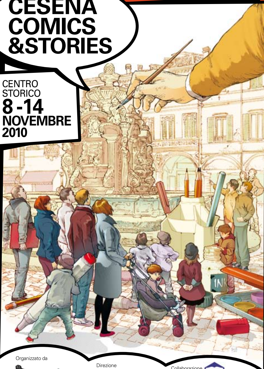
ILLUSTRAZIONE DI GIANLUCA PAGLIARANI